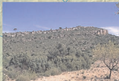
Cerro de la Peladilla