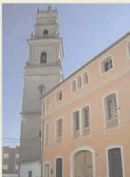
Col·lecció Museogràfica Garcia de Fuentes

Museu Etnogràfic: Arqueologia, Malacologia i Pintura. En ell es poden veure materials arqueològics procedents de diversos jaciments del municipi (Sala Molón), una col·lecció malacològica (Sala Siro de Fez) i una altra de pintura (Sala Garfella Moreno).