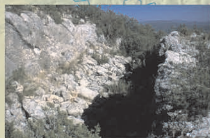
Cerro de San Cristóbal (fossat)