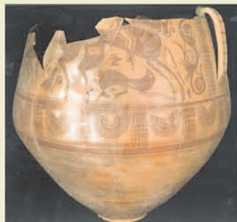
Gerra amb muscle bitroncònic